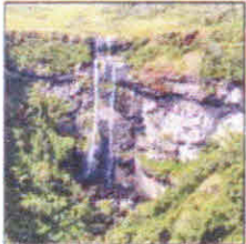
Canyon Índios Coroados