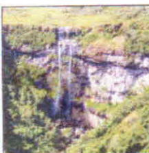
Canyon Índios Coroados