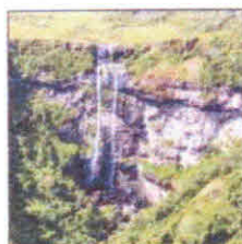
Canyon Índios Coroados