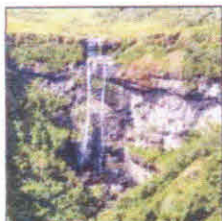
Canyon Índios Coroados