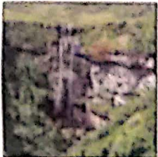
Canyon Índios Coroados