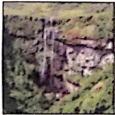
Canyon Índios Coroados