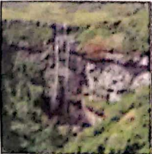
Canyon Índios Coroados