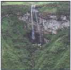
Canyon Índios Coroados