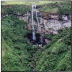
Canyon Índios Coroados