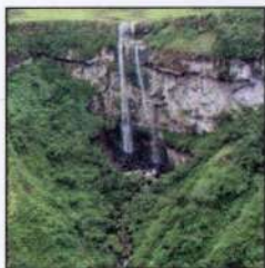
Canyon Índios Coroados